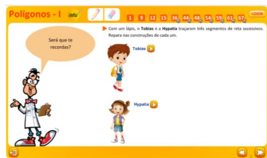
Figura 2 – O Tobias e a Hypatia