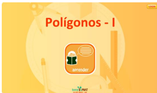
Figura 1- Applet