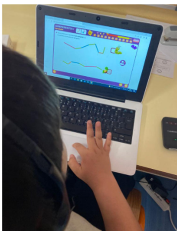
Figura 3- Aluno do 1.º ano a executar a frame