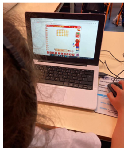
Figura 4- Aluno do 2.º ano a executar a frame