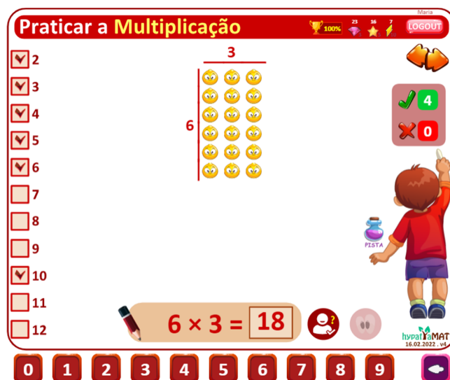
Figura 2- Praticar a Multiplicação (2.º ano)