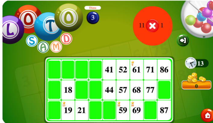
Figura 1 – Applet “Loto SAMD” da Plataforma HypatiaMat