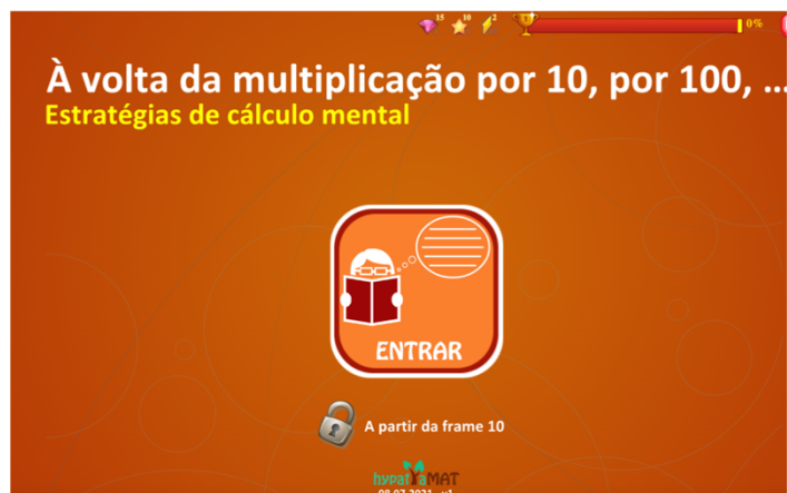
Figura 1 – Applet “À volta da multiplicação por 10, por 100, ... Estratégias de cálculo mental” da Plataforma HypatiaMat

No âmbito da Prática Educativa Supervisionada do 1.º CEB, no passado dia 17 de janeiro de 2022, com a turma do 4.º A do Centro Escolar Solum Sul, as estagiárias Diana Madeira e Patrícia Fernandes, do Mestrado em Educação Pré-Escolar e Ensino do 1.º Ciclo do Ensino Básico, recorreram à Plataforma HypatiaMat para a consolidação do conteúdo matemático da Multiplicação de uma dízima por 10, 100 ou 1000.