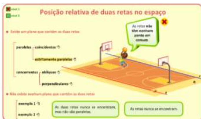
Figura 1 – Applet “Retas no Espaço”.

Desta forma, a estratégia utilizada foi bem conseguida, no sentido em que, por um lado, motivou a turma, e por outro ajudou a consolidar as aprendizagens.