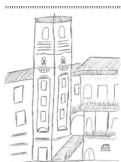
Fernando Ramos (Editor)®

The Institute for Philosophical Studies is sponsored by national funds via FCT - Foundation for Science and Technology, I.P., under the UID/FIL/00010/2020 project.